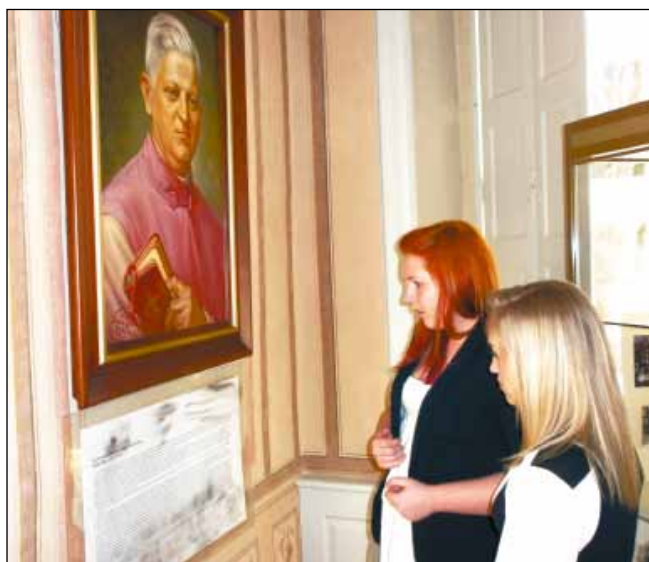
Członkowie Koła Historycznego na wystawie w muzeum.

Na maj zaplanowano dwa szkolne konkursy historyczne, a pięciu członków Koła Historycznego przygotowuje się do konkursu o Jakubie Wejherze.