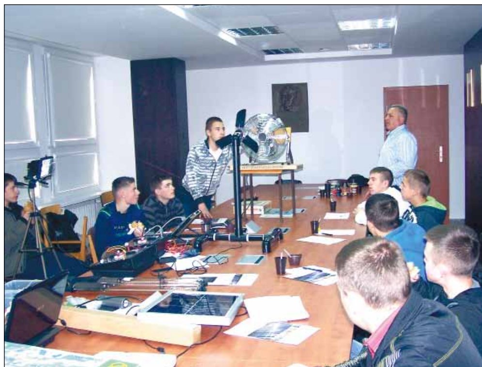
Uczniowie branży budowlanej, mechanicy i elektromechanicy samochodowi, dzięki współpracy szkoły z Politechniką Gdańską, biorą udział w programie staży i wizyt studyjnych, w Instytucie Maszyn Przepływowych PAN w Gdańsku.

Sprawiają jednocześnie, że absolwenci Niepublicznej Szkoły Rzemiosła stają się bardziej konkurencyjni na lokalnym rynku pracy, co znacznie zwiększa ich szansę na zatrudnienie w wyuczonych zawodach.