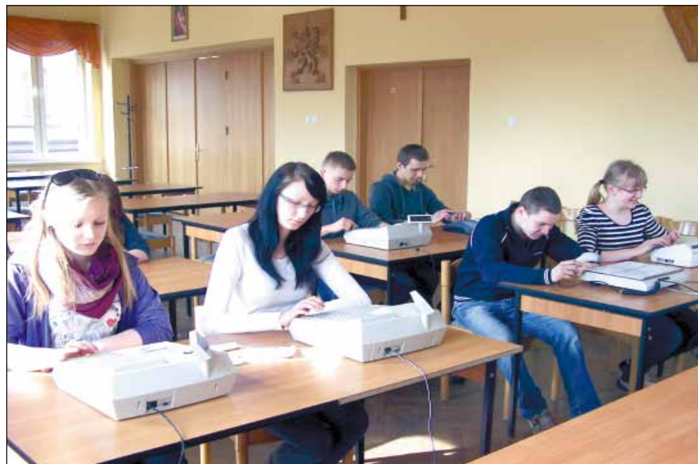
Zdjęcie u góry: Nauka zawodu w klasie sprzedawców.

Dla zapewnienia pełnej informacji o szkole stworzono stronę internetową: www.szkoła.cechwejherowo.pl , na której zamieszczane są wszystkie aktualności szkolne, informacji o zajęciach pozalekcyjnych, egzaminach zawodowych, o rekrutacji i jej zasadach, oraz dokumenty, a w nich wykaz obowiązujących w szkole podręczników.