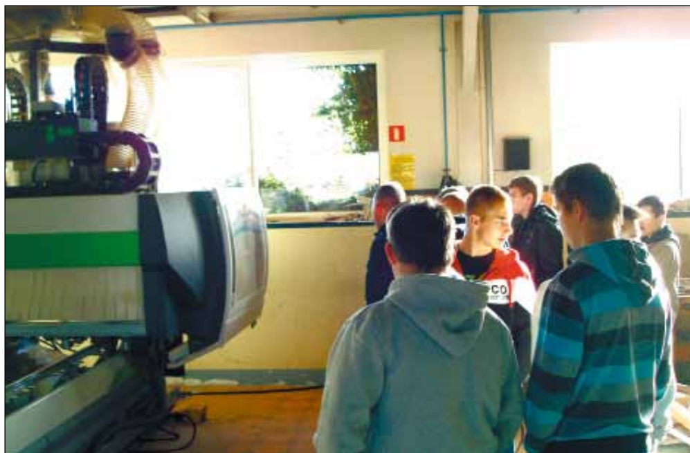
U dołu po prawej: Jedna z pracowni szkolnych.