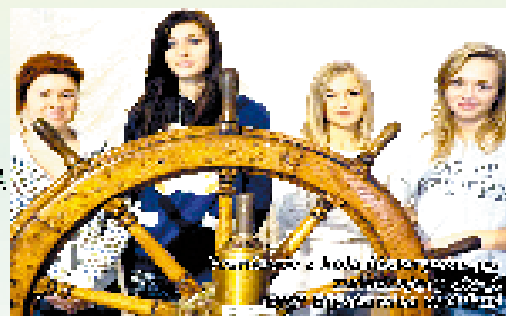
Wzajemny projekt partnerski w ramach projektu "Wzajemne projekty partnerskie w ramach projektu"