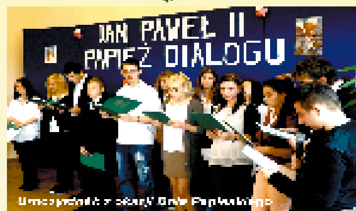
Umocnienie w sferze Dobrej Praktyki

Wszystkie zawody oferujemy w ramach 100% czasu zajęć praktycznych w klasach warsztatowych.