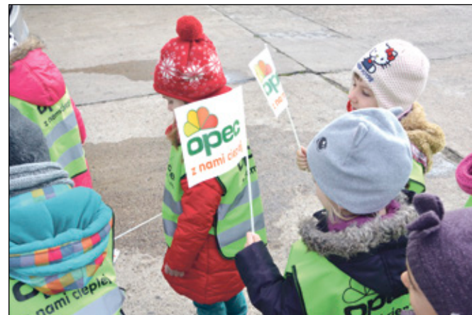
Wizyta dzieci z Przedszkola im. Kubusia Puchatka w ZEC Wejherowo.

współpracy z KZG „Dolina Redy i Chylonki” prowadzi od lat warsztaty terenowe dla szkół gimnazjalnych i ponadgimnazjalnych oraz seminaria dla Słuchaczy Uniwersytetu III wieku z Wejherowa.