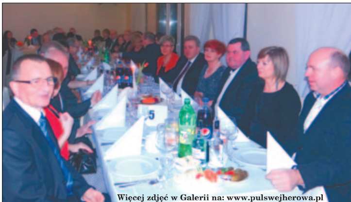
Więcej zdjęć w Galerii na: www.pulswejherowa.pl

Do tańca przygrywał zespół „Supra”, a uczestnicy chętnie spędzali tę noc na parkiecie. Wszak karnawał to najlepszy czas na zabawę przy muzyce. AK.